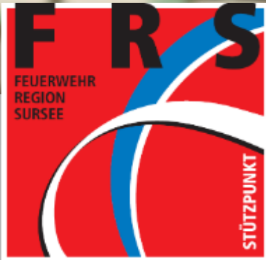
Feuerwehr Region Sursee, Luzern