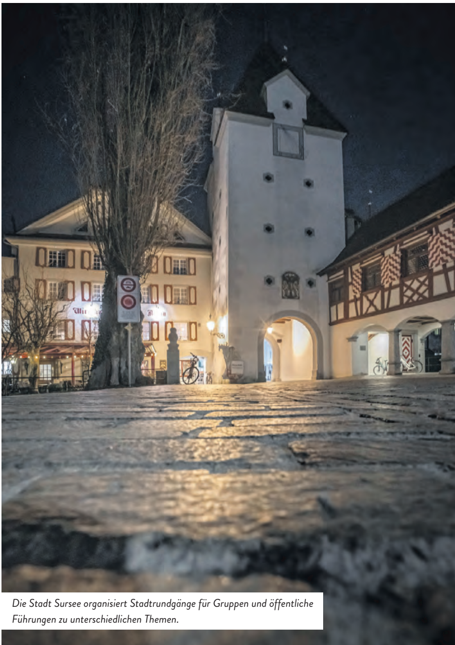
Die Stadt Sursee organisiert Stadtrundgänge für Gruppen und öffentliche Führungen zu unterschiedlichen Themen.