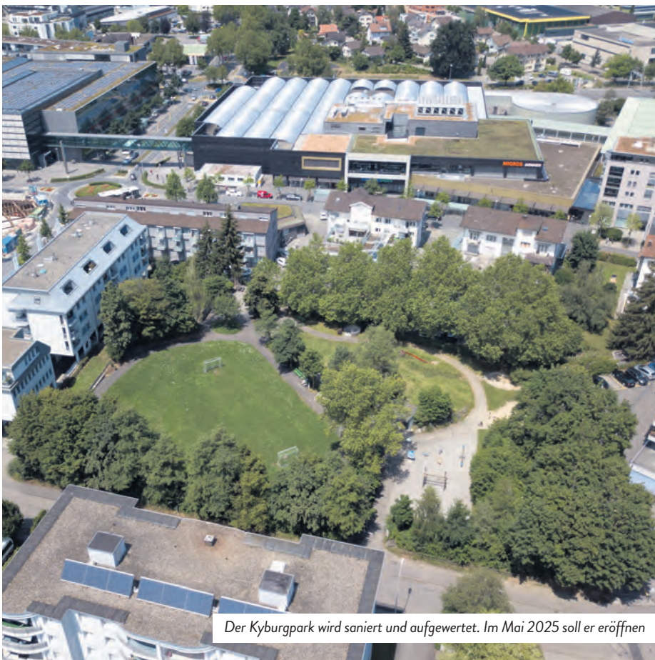
Der Kyburgpark wird saniert und aufgewertet. Im Mai 2025 soll er eröffnen