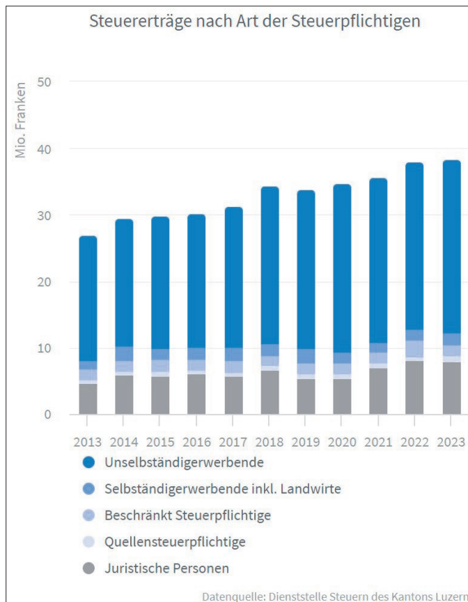
In dieser Art setzen sich die Steuererträge der Stadt Sursee zusammen.