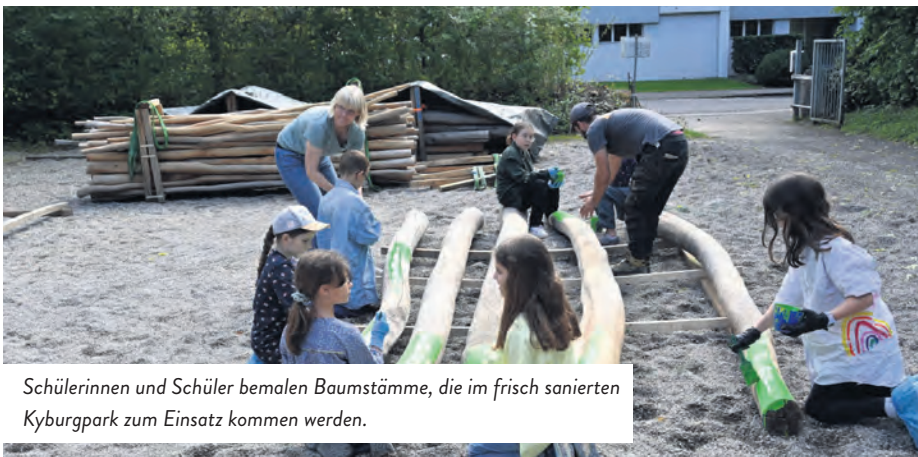
Schülerinnen und Schüler bemalen Baumstämme, die im frisch sanierten Kyburgpark zum Einsatz kommen werden.