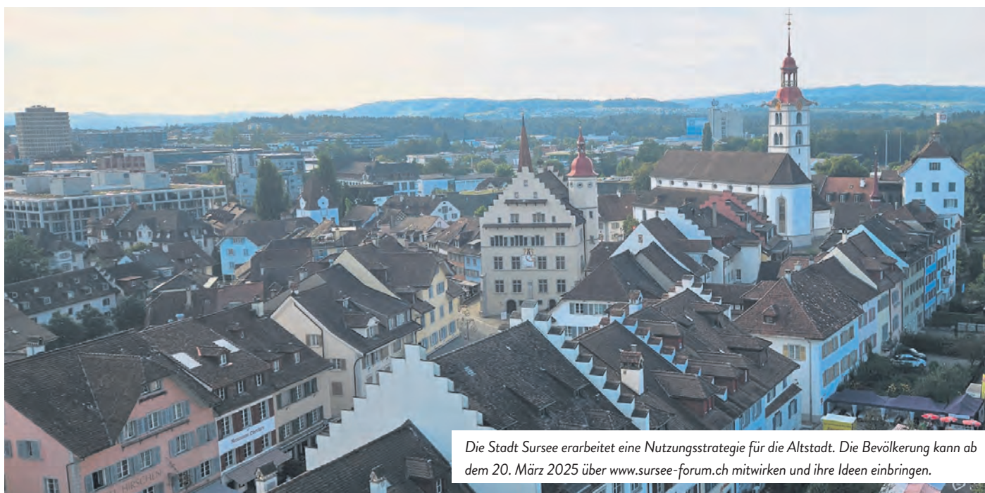
Die Stadt Sursee erarbeitet eine Nutzungsstrategie für die Altstadt. Die Bevölkerung kann ab dem 20. März 2025 über www.sursee-forum.ch mitwirken und ihre Ideen einbringen.

Öffentlicher Anlass: 19. März 2025, 19.30 Uhr, Pfarreizentrum, St.-Urban-Strasse 8, Sursee.