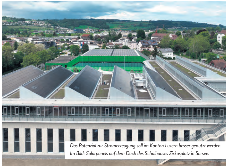
Das Potenzial zur Stromerzeugung soll im Kanton Luzern besser genutzt werden. Im Bild: Solarpanels auf dem Dach des Schulhauses Zirkusplatz in Sursee.

Bereits am 1. März 2025 trat das neue kantonale Energiegesetz in Kraft, auf dem der Gegenvorschlag zur Solarinitiative aufbaut. Im Paragraf 15 des kEnG steht neu, dass Neubauten und bestehende Bauten bei einer Dachsanierung das Potenzial zur Stromerzeugung angemessen ausnutzen müssen oder eine Ersatzabgabe zu leisten haben. Was eine angemessene Potenzialausnutzung ist und was unter einer Dachsanierung verstanden wird, präzisiert die neue kantonale Energieverordnung. Diese hält fest, dass bei Neubauten mindestens 50 Prozent der nutzbaren Dachfläche belegt werden müssen, bei bestehenden Bauten mindestens 25 Prozent. In der Botschaft zu den Änderungen des Energiegesetzes sprach der Regierungsrat noch von 60 Prozent der Dachfläche bei Neubauten. Gemäss Auskunft der Dienststelle Umwelt und Energie habe man unterdessen jedoch herausgefunden, dass die An-