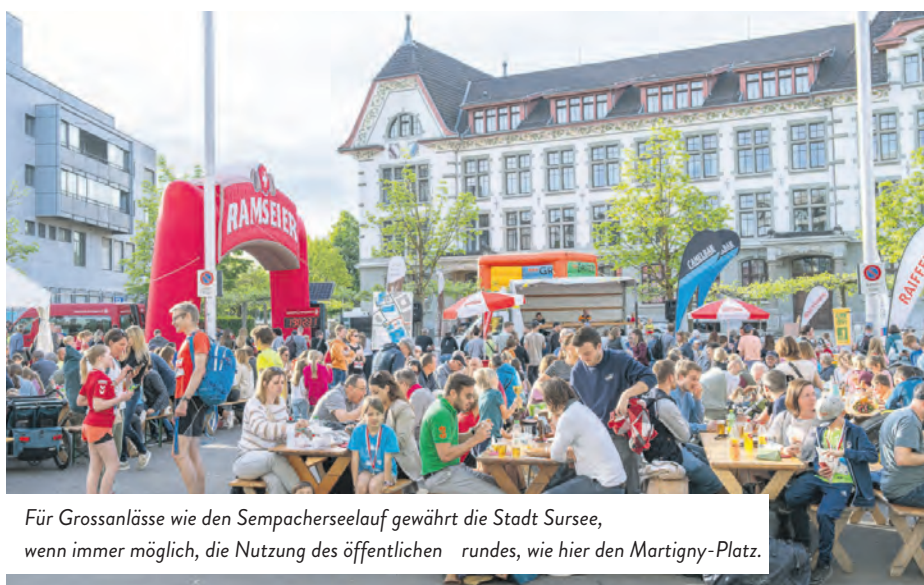
Für Grossanlässe wie den Sempacherseelauf gewährt die Stadt Sursee, wenn immer möglich, die Nutzung des öffentlichen Grundes, wie hier den Martigny-Platz.

Haben Sie konkrete Fragen? Gerne gibt Ihnen der Bereich Öffentliche Sicherheit, Tel. 041 926 91 11, sicherheit@stadtsursee.ch , Auskunft.