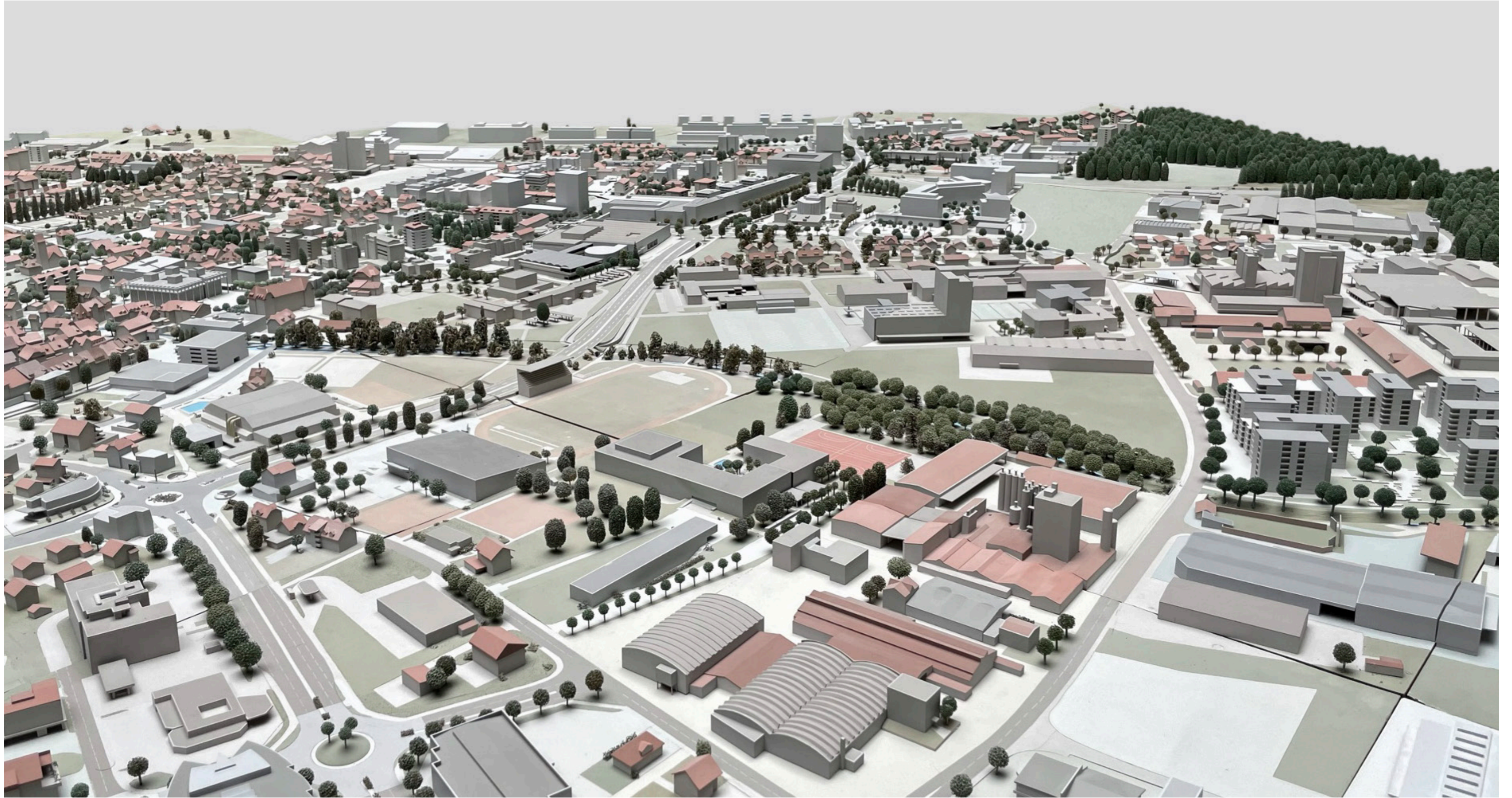
Fernwirkung aus Richtung Nord-/ Nordost

Art. 10 Fern-/ Gesamtwirkung, Richtlinien Hochhäuser und Höhere Häuser der Stadt Sursee vom 24.06.2015: Wirkung auf die Stadtkulisse und Eingliederung in das lokale Stadtbild