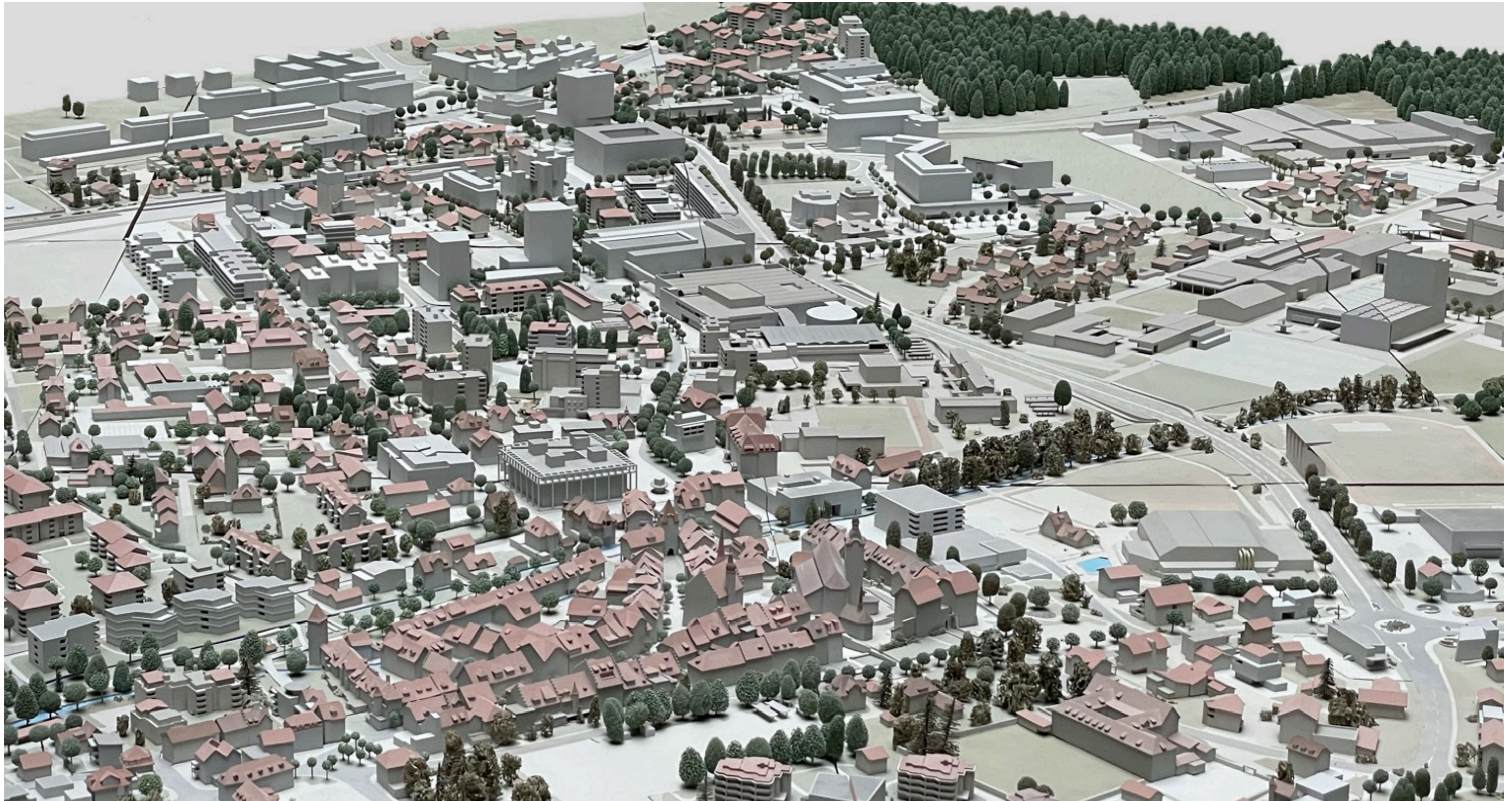
Fernwirkung aus Richtung Osten, Altstadt im Vordergrund

Art. 10 Fern-/ Gesamtwirkung, Richtlinien Hochhäuser und Höhere Häuser der Stadt Sursee vom 24.06.2015: Wirkung auf die Stadtkulisse und Eingliederung in das lokale Stadtbild