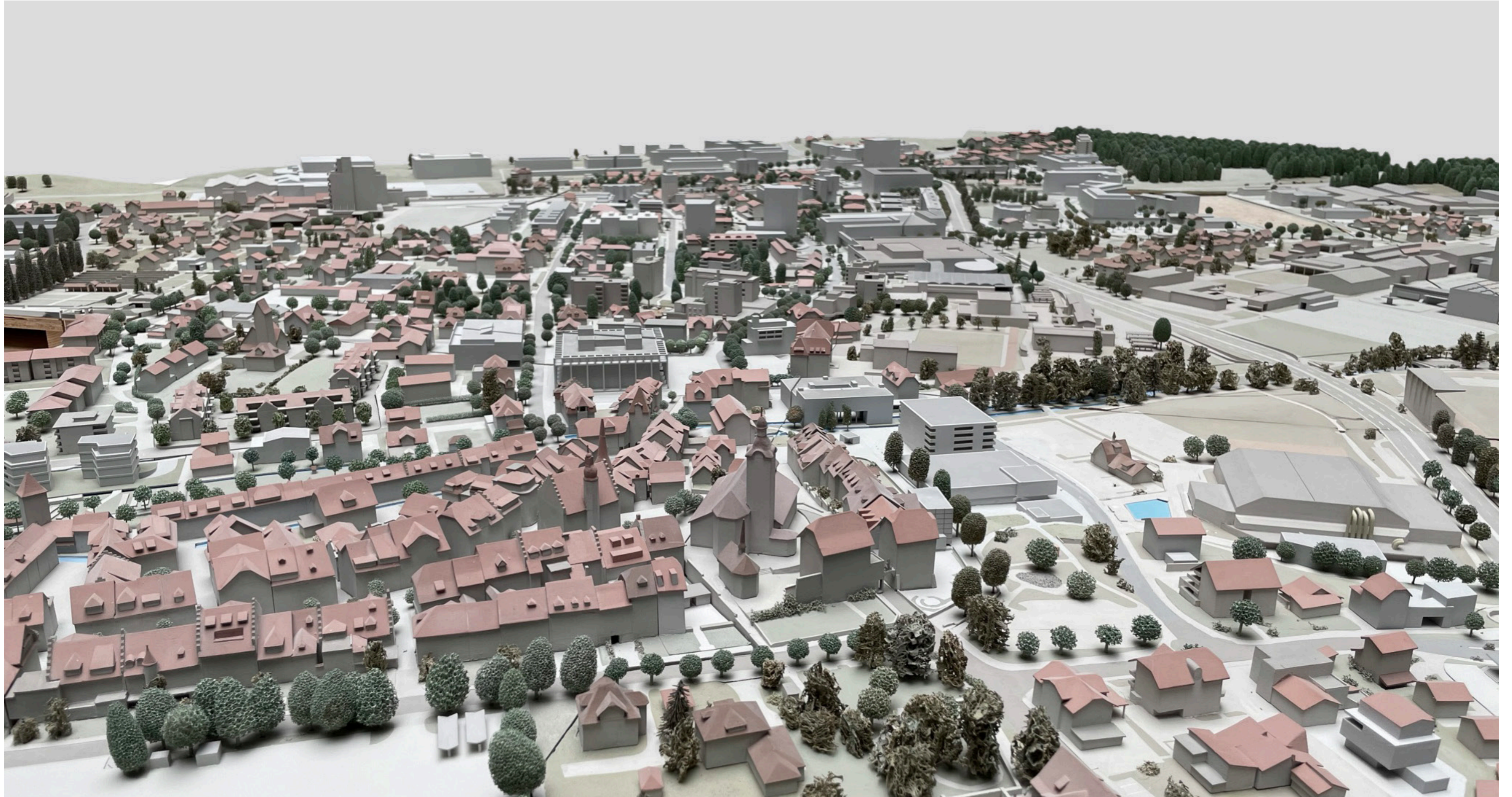
Fernwirkung aus Richtung Nordost, Altstadt im Vordergrund

Art. 10 Fern-/ Gesamtwirkung, Richtlinien Hochhäuser und Höhere Häuser der Stadt Sursee vom 24.06.2015: Wirkung auf die Stadtkulisse und Eingliederung in das lokale Stadtbild