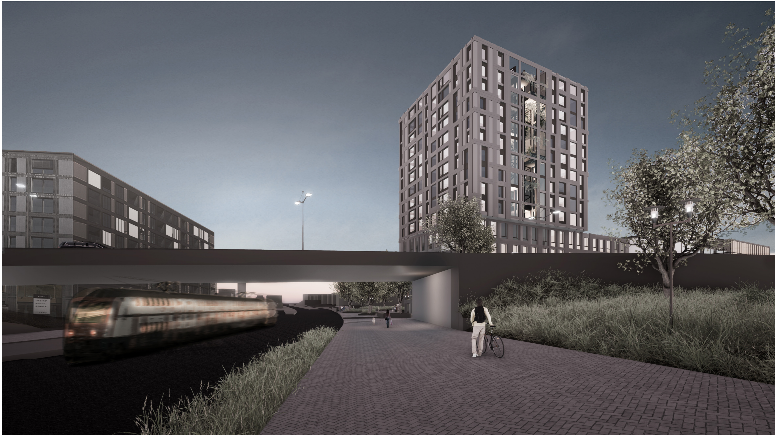
Ansicht von Seite Pilatusstrasse: Ausdruck in feuerverzinktem Stahl, Bänder auf einer Ebene