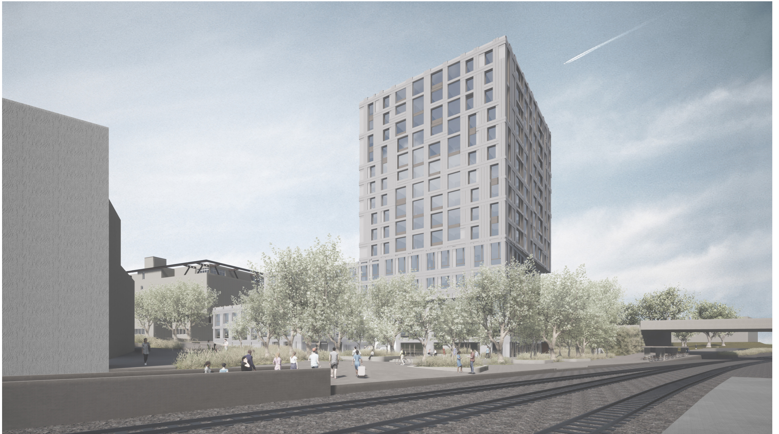
Ansicht von Seite Bahnhofplatz: Ausdruck in feuerverzinktem Stahl, Bänder auf einer Ebene

Bahnhof Nord Immobilien AG, 6210 Sursee, 26.02.2021