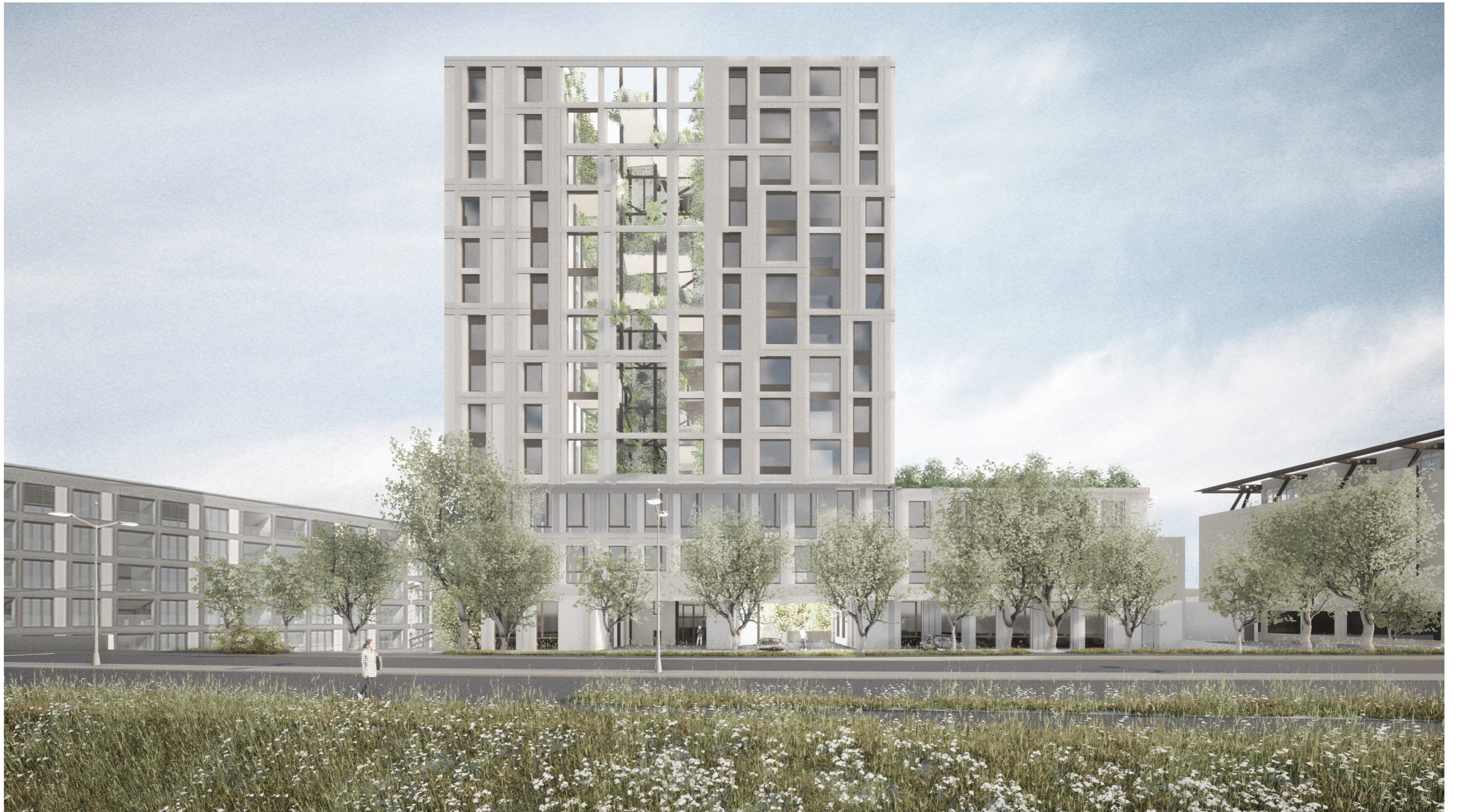
Ansicht von Seite Ringstrasse: Ausdruck in feuerverzinktem Stahl, Bänder auf einer Ebene

Bahnhof Nord Immobilien AG, 6210 Sursee, 26.02.2021