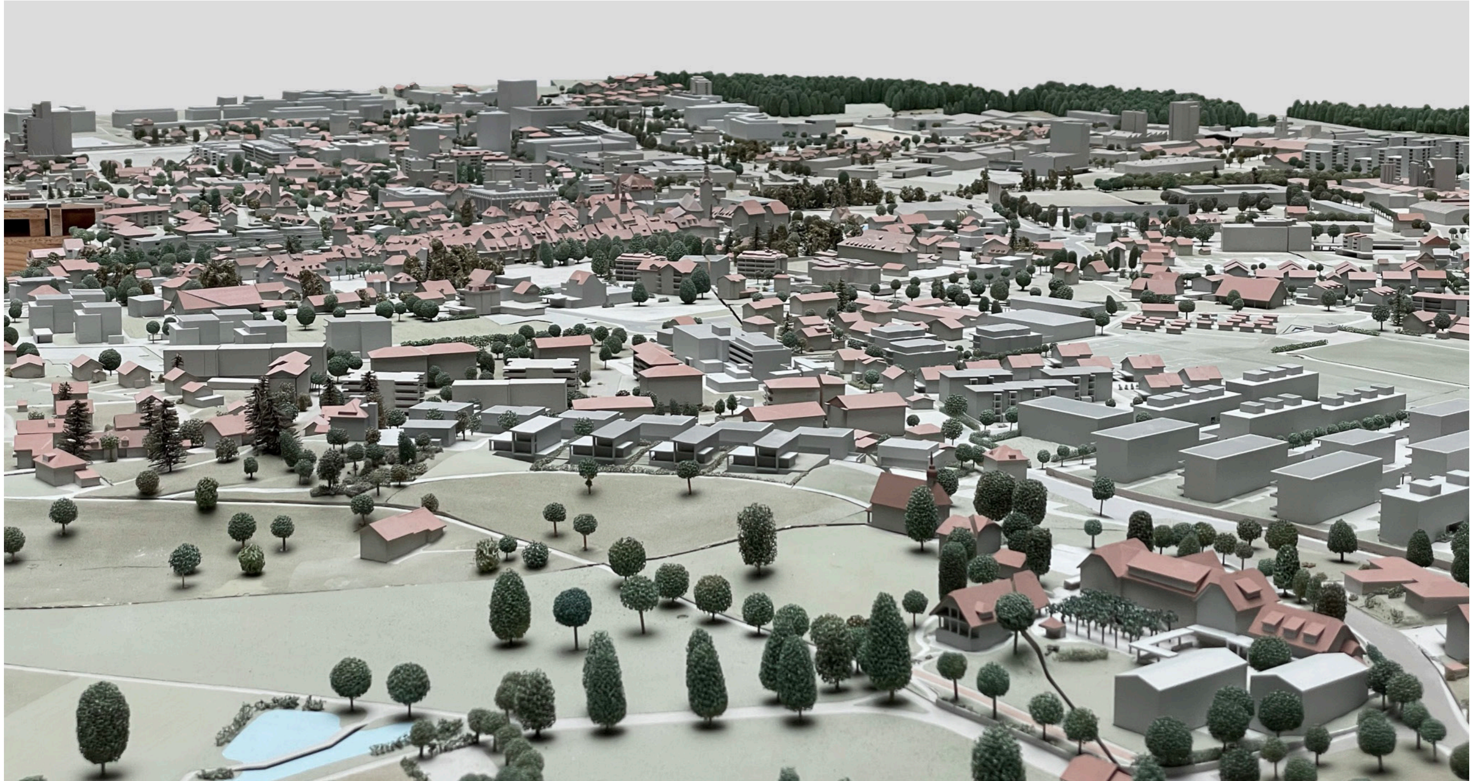
Fernwirkung aus Richtung Triechter, Sempachersee

Art. 10 Fern-/ Gesamtwirkung, Richtlinien Hochhäuser und Höhere Häuser der Stadt Sursee vom 24.06.2015: Wirkung auf die Stadtkulisse und Eingliederung in das lokale Stadtbild