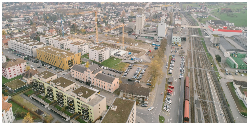
Abb.: Luftaufnahme mit bestehenden Zu- und Wegfahrten zu den Einstellhallen an der Centralstrasse

Die Einstellhalle für die Centralstrasse 37/39 (Baubereich J) erfolgt über eine eigene Zu- und Wegfahrt.