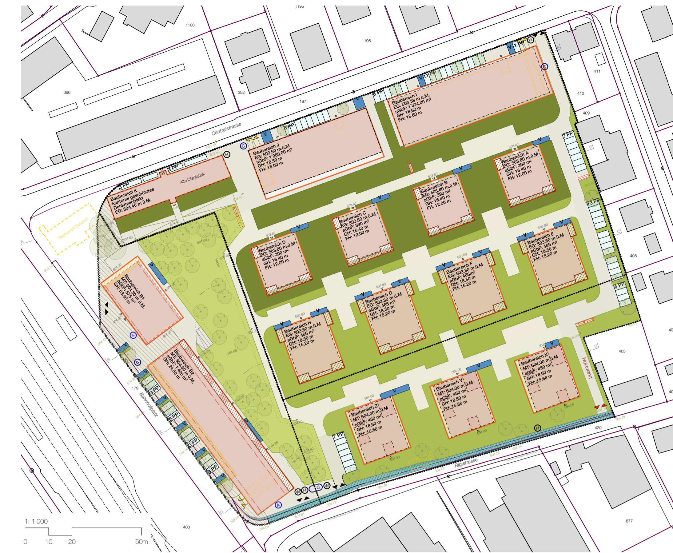
Erschliessung und Parkierung, Situation Erdgeschoss 1:1000