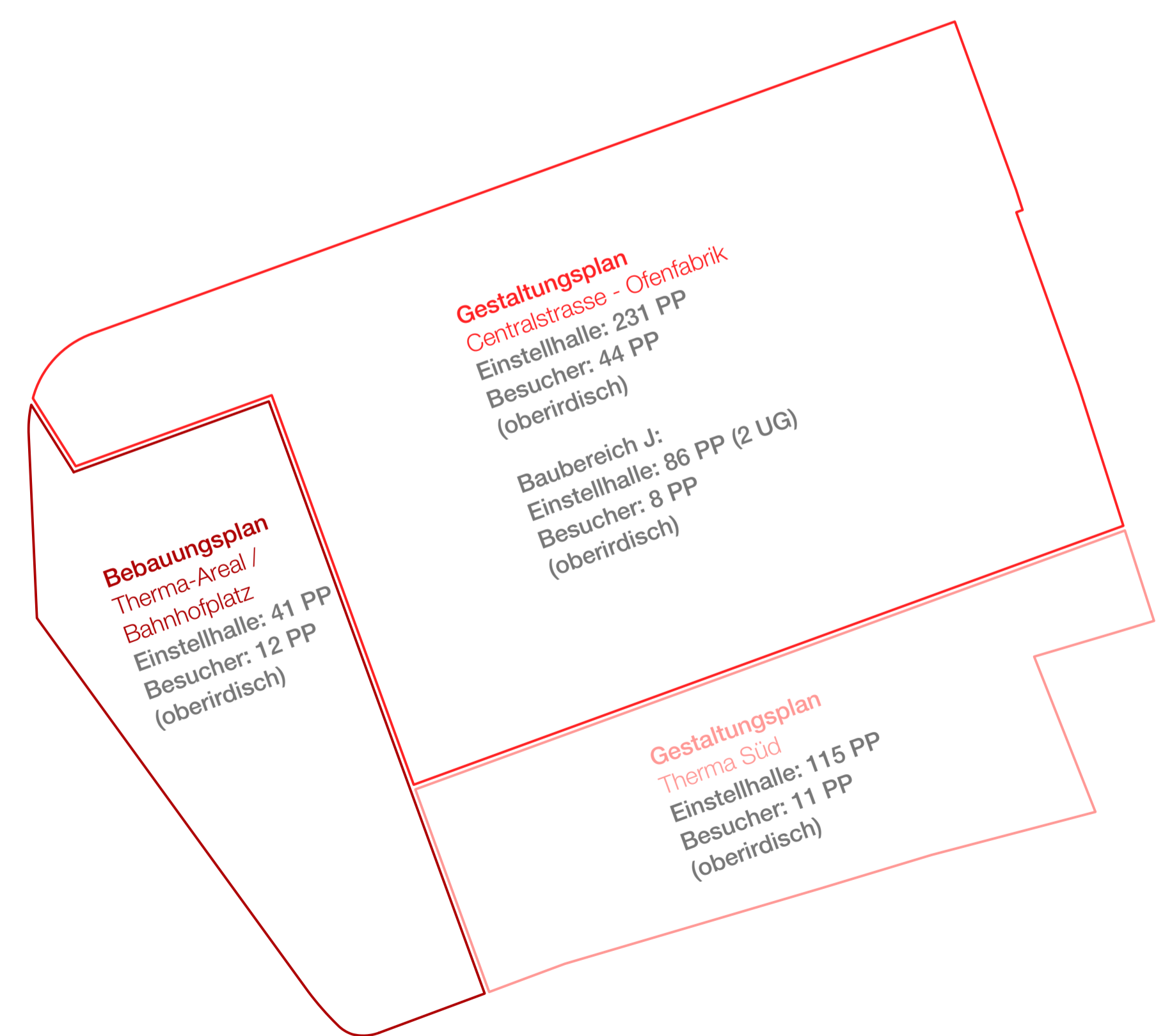
Anzahl und Verteilung der Parkfelder, in Einstellhalle und auf EG-Niveau, 1:1'000